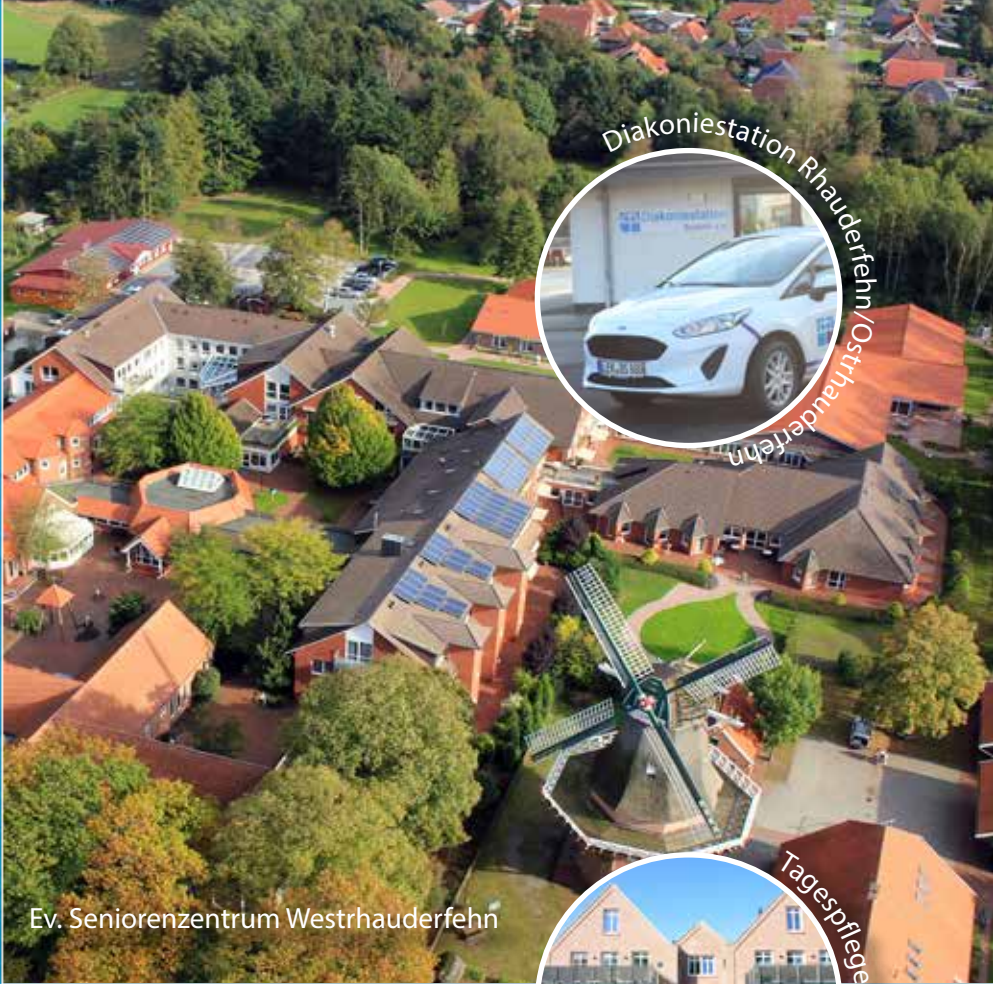
Ev. Seniorenzentrum Westrhaderfehn

Tel.: 0 49 52 / 92 03 0 • info@reilstift.de www.reilstift.de