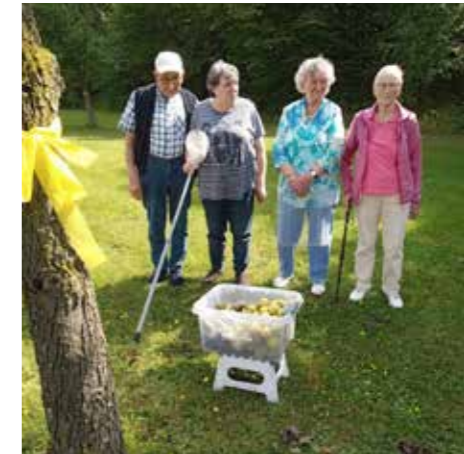
HOF JANSSEN - Das Angebot KOSTENLOS OBST an markierten Bäumen zu pflücken haben die Gäste der Tagespflege genutzt und die Äpfel gleich zu Apfelkuchen und -marmelade verarbeitet.