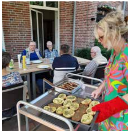
HOF JANSSEN - Die Gäste der Tagespflege haben GEMEINSAM GEKOCHT und das Essen anschließend auf der Terrasse genossen.