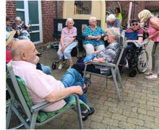
HOF JANSSEN - Die Gäste der Tagespflege haben die SENIORENRESIDENZ LINDENHOF in Ihrhove besucht und dabei ein leckeres Eis genossen.