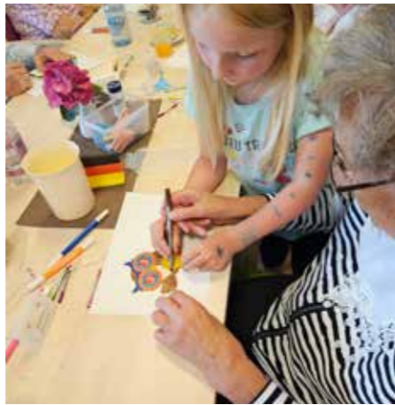
HOF JANSSEN - Mit Unterstützung wurden Eulen als WINDSPIELE gebastelt.