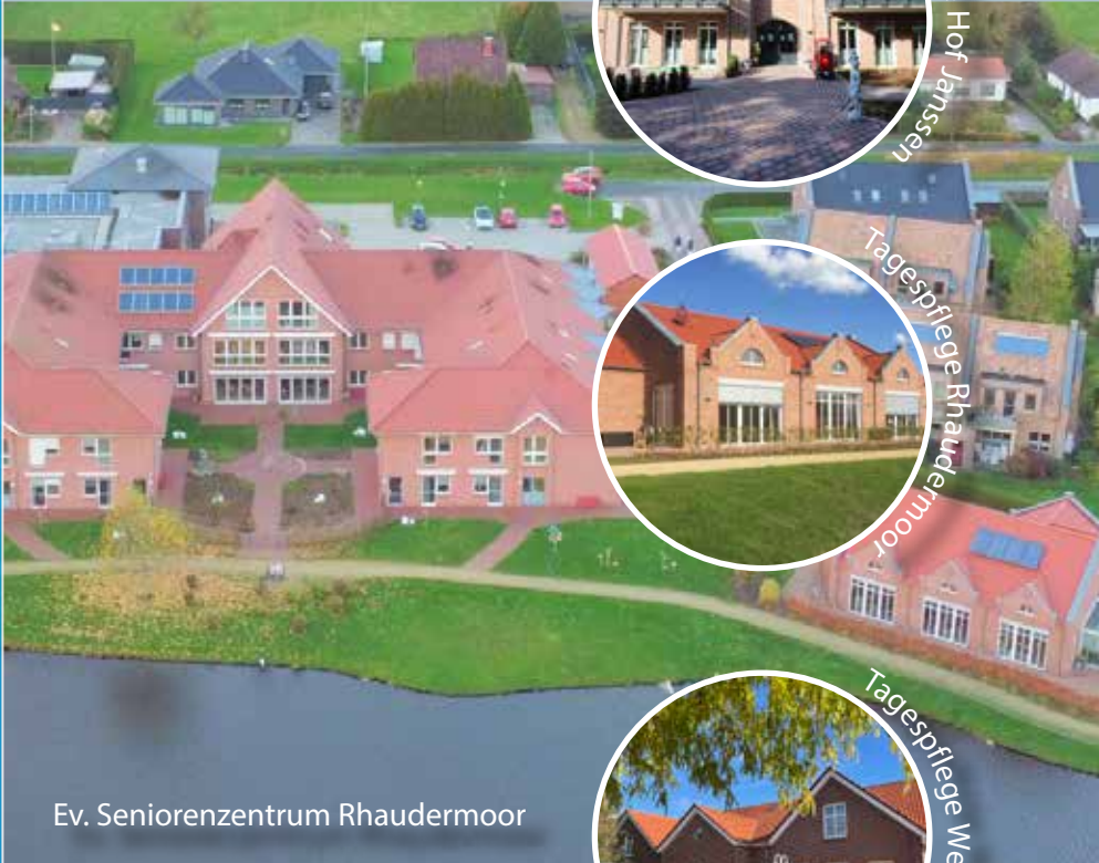
Ev. Seniorenzentrum Rhadermoor