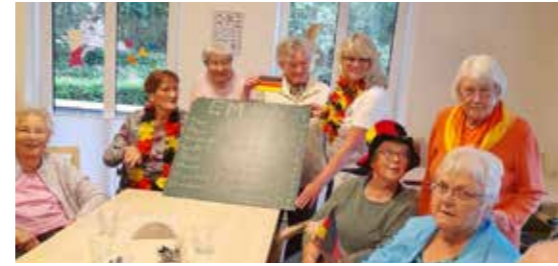
HOF JANSSEN - Zur FUSSBALL-EM war in der Tagespflege in Ihrhove das Fußballfieber ausgebrochen.