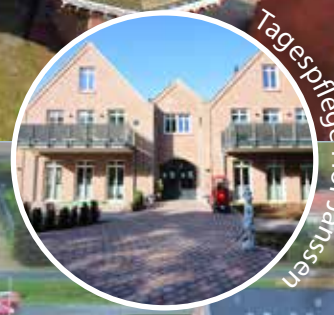
Tagespflege Hof Janssen