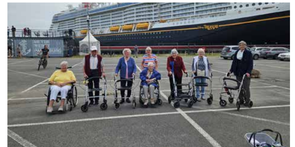
HOF JANSSEN - Ausflug zum MEYER-WERFT-GELÄNDE um das neuste Disney Schiff zu bewundern.