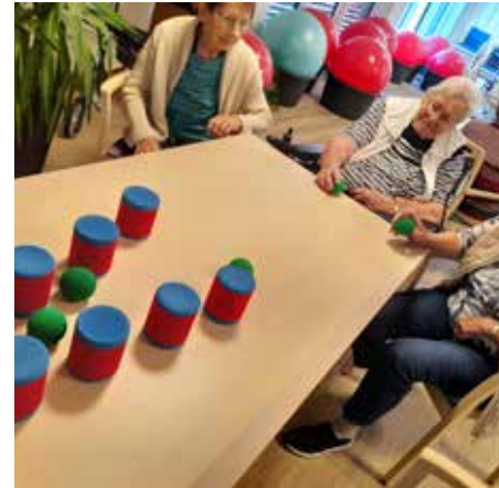
SPIELVORMITAG - Bewohner beider Seniorenzentren trafen sich zum gemeinsamen Spielen in Rhaudermoor – von M.ä.d.n. über Domino bis Shuffleboard. Viel Spaß für alle!