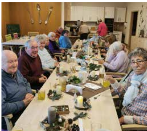
HOF JANSSEN - Die Gäste haben sich WEIHNACHTS- GESTECKE gebastelt.