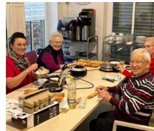
RHAUDERMOOR- NEUJAHRSKUCHEN wurden gebacken.