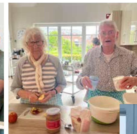
RHAUDERMOOR - ÄPFEL wurden zu Apfelmus und später zu Kuchen verarbeitet.