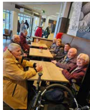
HOF JANSSEN - EINKAUFSFAHRT zum Sonderpostenmarkt von Wreesmann mit anschließenden Kaffee & Kuchen beim Bäcker.