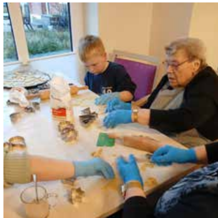
HOF JANSSEN - Tatkräftige Unterstützung bekamen die Gäste beim PLÄTZCHEN BACKEN.