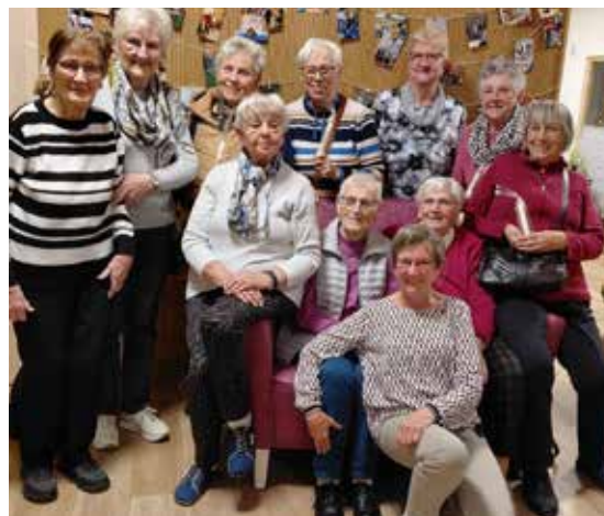
HOF JANSSEN - SENIOREN DER KIRCHENGEMEINDE FLACHSMEER hat die Tagespflege in Ihrhove besucht.