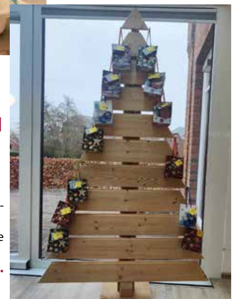
RHAUDERMOOR- Der selbstgestaltete ADVENTSKALENDER.