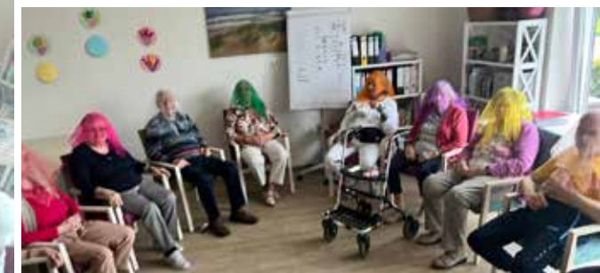
RHAUDERMOOR - GYMNASTISCHE ÜBUNGEN