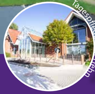
Ev. Seniorenzentrum Rhadermoor