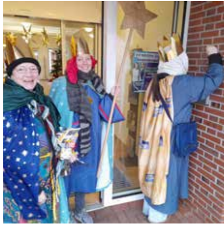
STERNSINGER bringen den Segen ins Haus und sammeln für Kinder in Bangladesch.