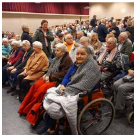
THEATERFAHRT NACH RHAUDERMOOR begeistert mit plattdeutschem Humor.