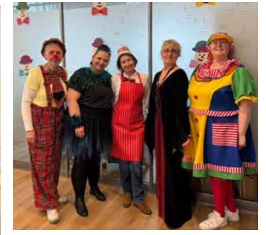
RHAUDERMOOR, OSTERFEHN & HOF JANSSEN - Unsere drei Tagespflegen haben jeweils ein tolles buntes Programm zu KARNEVAL auf die Beine gestellt. Und ausgelassen Karneval gefeiert.