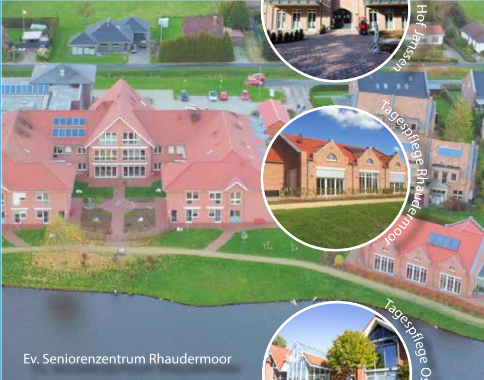
Ev. Seniorenzentrum Rhadermoor