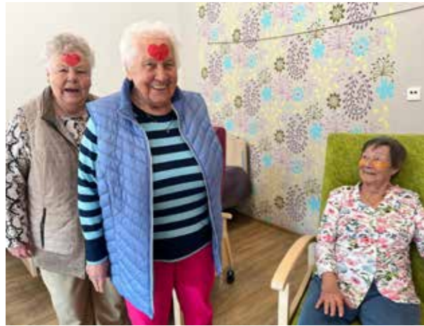
RHAUDERMOOR - VERWÖHNPROGRAMM MIT HERZ und jeder Menge Spaß.