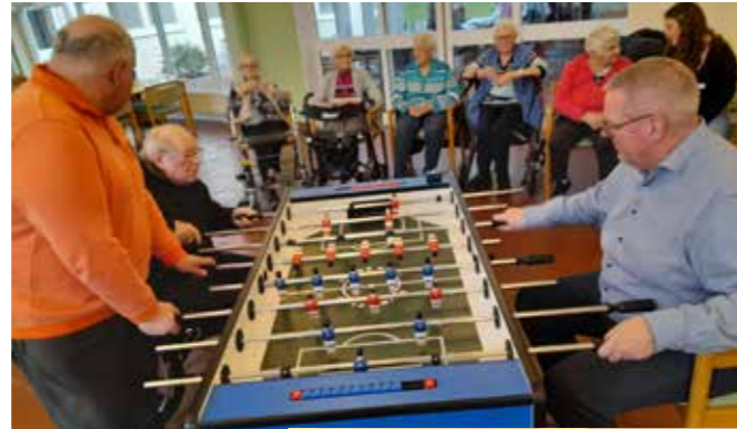
Im Speisesaal des Seniorenzentrums Westrhauderfehn fand wieder ein spannendes TISCHKICKER-TURNIER mit starken Duellen und erfolgreichen Titelverteidigern statt.