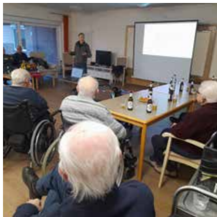
„KULTURELLER HERRENSTAMMTISCH“ mit spannendem Vortrag und geselligem Ausklang.