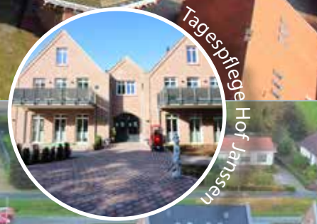
Tagespflege Hof Janssen