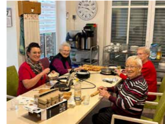
RHAUDERMOOR-NEUJAHRSKUCHEN wurden gebacken.