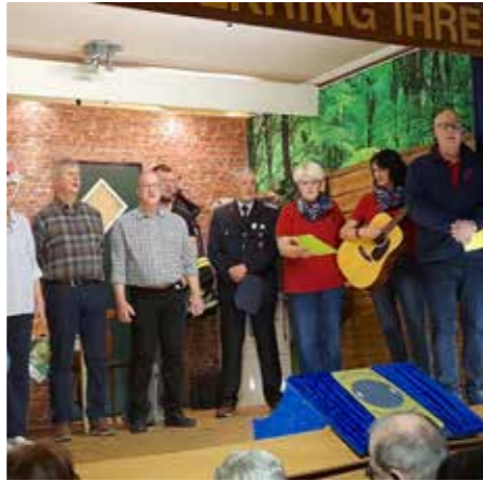
Fröhlicher Theaterbesuch beim „SPÖLKRING IHREN“ mit viel Lachen, Applaus und gemeinsamen Gesang.