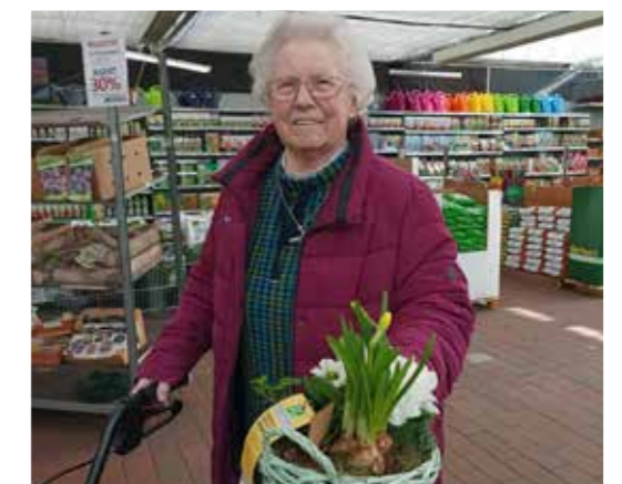
OSTERFEHN - FRÜHLING endlich ist er da! Besuch der Kirche in Backemoor und Blumen einkaufen bei Edelkamp in Aschendorf