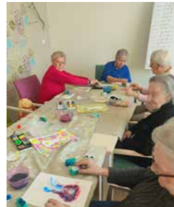
RHAUDERMOOR - Die Gäste stimmen sich bereits auf OSTERN ein.