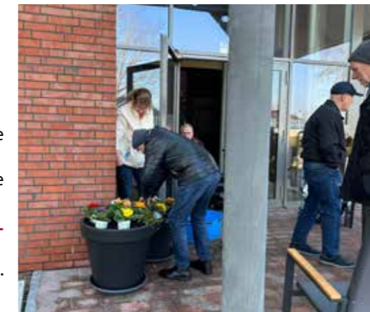
OSTERFEHN - Die Gäste der Tagespflege haben die BLUMENKÜBEL BEPFLANZT.