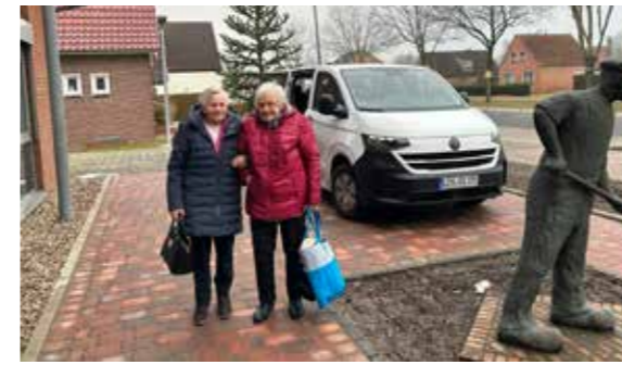
OSTERFEHN - FREUNDINNEN auf dem Weg zur Tagespflege.