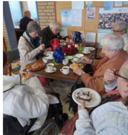
Viele kunstvoll gestaltete Eier und Eierdekoration gab es auf dem OSTFRIESISCHEN OSTEREIERMARKT IN FILSUM zu sehen. Nach dem Rundgang durch die Ausstellung wurde gemütlich in der Cafeteria Kaffee und Torte verzehrt.