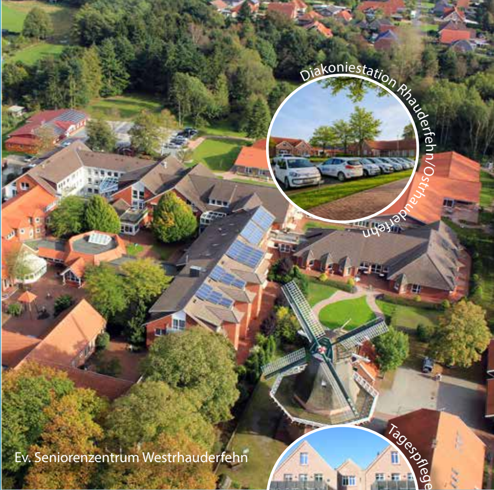
Ev. Seniorenzentrum Westrhaderfehn

Tel.: 0 49 52 / 92 03 0 • info@reilstift.de www.reilstift.de